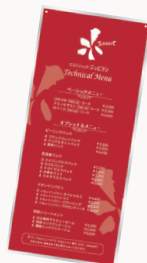
メニュープレート