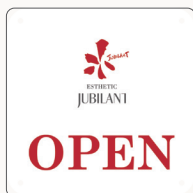
オープンプレート