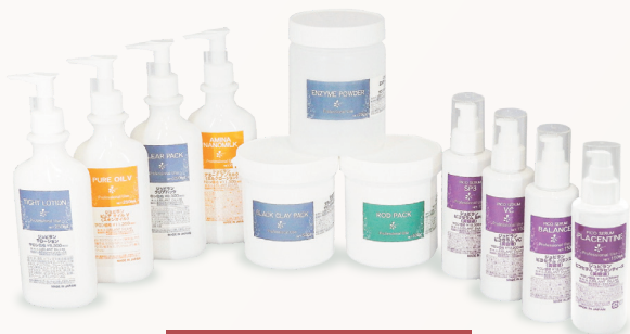
業務用化粧品12万円分